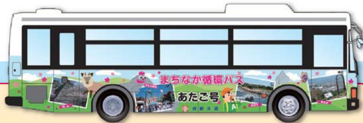
外回り線(時計回り) あたご号