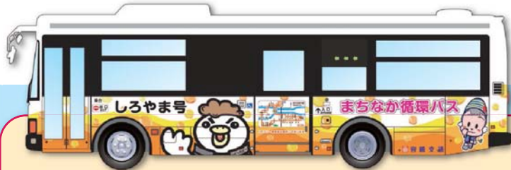
内回り線(反時計回り) しろやま号