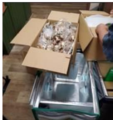
第1弾「バスあいのりマルシェ」(左)、宮崎での梱包の様子(右)