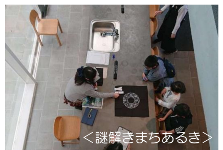
<謎解きまちあるき>