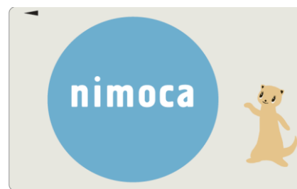
n i m o c a 通常デザイン