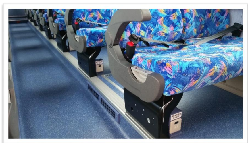
□ コンセントは各席に配置。 窓側は壁面に。通路側は画像のように座席下の足元にあらたに設置しました。