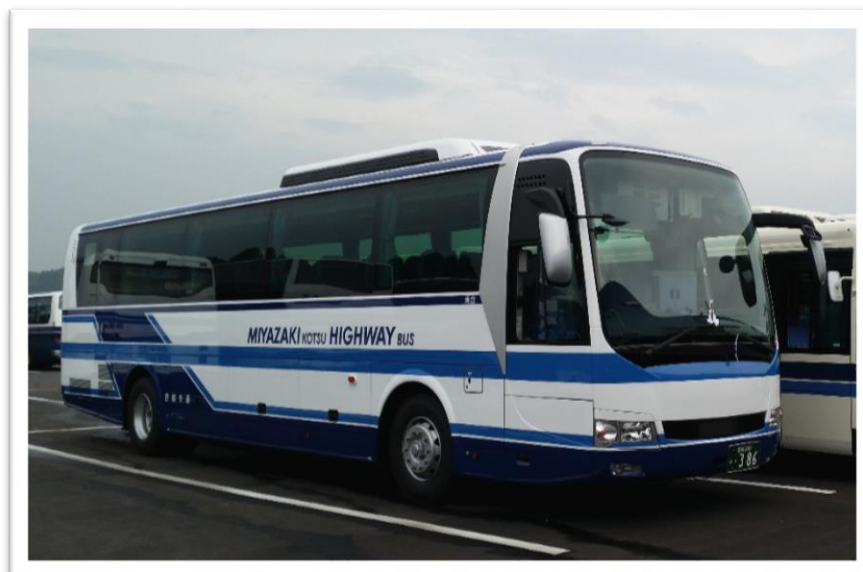
□ 4月より大分線に投入予定の新型車両 外観