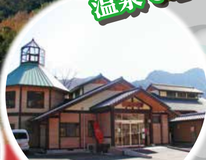
祝子川温泉 美人の湯 定休日:木曜日(祝日の場合は営業) 年末年始(12/31~1/2)